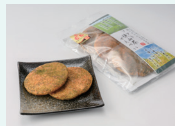
彩の国ブランドフォーラム株式会社 ソフト狭山茶せんべい