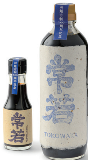
笛木醤油株式会社 とこわか 常若

原料、仕込みに使用した大桶の木材まで究極のオール埼玉産を突き詰めた醤油。3年間熟成でワインのような深みのある味です。