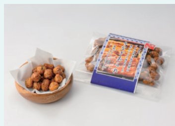
彩の国ブランドフォーラム株式会社 うなぎあられ