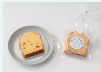
株式会社酒井甚四郎商店 PAUNNA (ならづけパウンドケーキ)