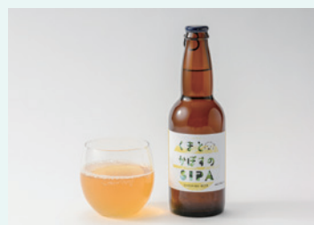
秩父麦酒醸造所 くまとかぼすのSIPA