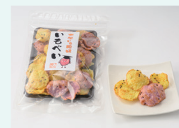
株式会社 東彰 いもべい (大学芋風味)