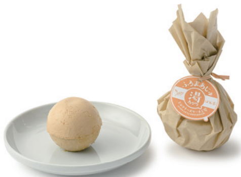
株式会社 温泉道場 ふろまあじゅ ほうじ茶

埼玉県産の乳製品や埼玉を代表する銘茶・狭山茶を使用した、和を感じるほうじ茶の香り豊かなミルクチーズケーキです。