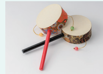
関口商店 開運でんでん太鼓“雅”