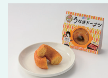
(株)長沢機械製作所食品部 浦和グリーンワゴン うなぎドーナツ