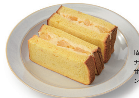
hoppe * hoppe なつみちゃんさんど

日本では珍しい燻製紅茶と燻製煎茶。秩父のウイスキー樽チップで燻製をかけました。チーズやナッツなど、おつまみ系とのペアリングがよい商品です。