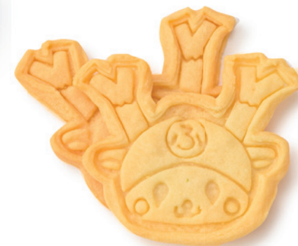
Pummy ふっかちゃんクッキー

埼玉県産の夏みかん、卵、小麦粉（ハナマントン）を使った、ほろ苦くて甘酸っぱい、さわやかなフルーツサンドです。