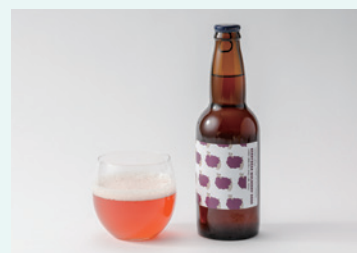
秩父麦酒醸造所 ベリーベアマルベリー