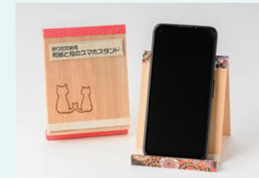
関口商店 折りたためる和紙と桧の スマホスタンド