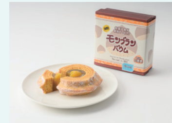
有限会社 栗こま娘本舗亀屋 和菓子屋が本気で作る!? モンブランバウム