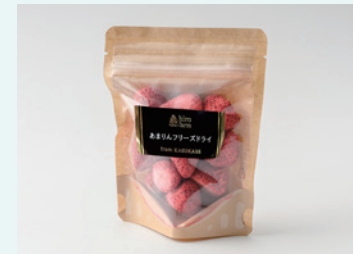
株式会社ヒロファーム あまりんフリーズドライ