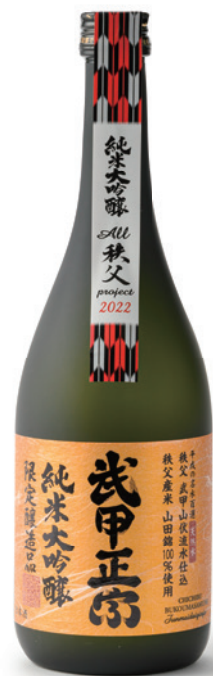
武甲酒造株式会社 オール秩父プロジェクト 純米大吟醸

有機素材のみにこだわり、深い旨みとすっきりとした甘さが特徴。素材の味を邪魔せず、すき焼き以外の料理にも活用できます。