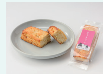
合同会社マルトク トウノスコーン