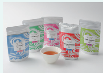
特定非営利活動法人 埼玉農業おうえんしたい 和紅茶シリーズ