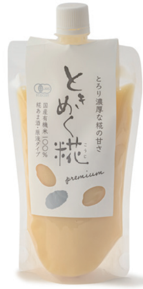
ヤマキ醸造株式会社 有機ときめく粧原液タイプ

農薬や化学肥料などを使わない、埼玉県産の有機米と、そのお米で仕込んだ粧だけで発酵させた甘酒の原液。調味料にもなります。