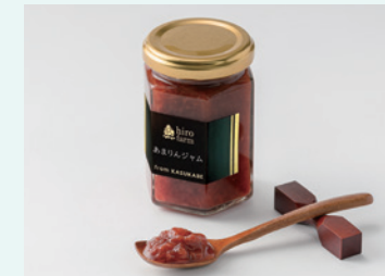
株式会社ヒロファーム あまりんジャム