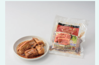
株式会社 埼玉種畜牧場・サイボク ゴールデンポーク角煮