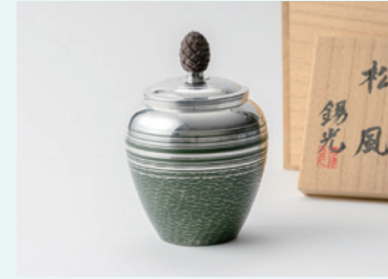
錫光 キャニスター松風