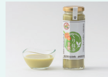
株式会社クリメン くり抹茶甘酒