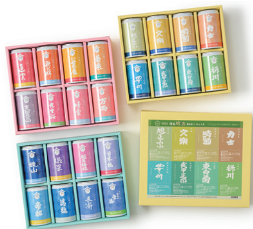
埼玉県酒造組合 埼玉酒蔵呑み比べセット2022 (1合缶セット)

乳、卵、塩不使用クッキーです。かわいらしいふっかちゃんの顔の形で1枚1枚、丁寧に焼き上げています。