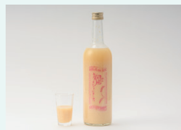
一般社団法人さまちか 麺の声きいちゃいました。