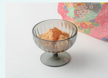
合同会社百幸 おうちで越谷わらびもちの素