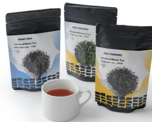
特定非営利活動法人 埼玉農業おうえんしたい 燻製茶シリーズ

埼玉県産の乳製品や埼玉を代表する銘茶・狭山茶を使用した、和を感じる抹茶の香り豊かなミルクチーズケーキです。