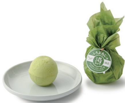
株式会社 温泉道場 ふろまあじゅ 抹茶

埼玉県産の乳製品や埼玉を代表する銘茶・狭山茶を使用した、和を感じるほうじ茶の香り豊かなミルクチーズケーキです。