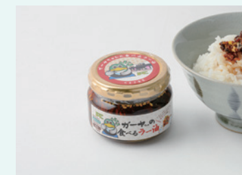
合同会社百幸 ガーヤちゃんの食べるラー油