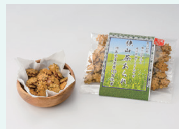
彩の国ブランドフォーラム株式会社 狭山茶あられ