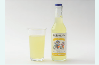
麻原酒造株式会社 彩果のしずく