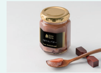
株式会社ヒロファーム あまりんバター