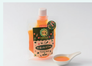
地場野菜イタリアン カボナータ 野菜のかけジャム(にんじん)