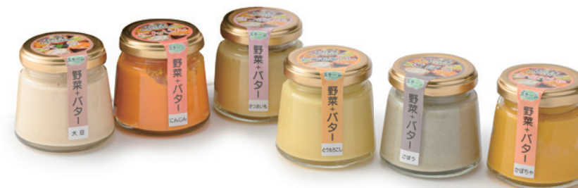
マルツ食品株式会社 野菜+バター

原料、仕込みに使用した大桶の木材まで究極のオール埼玉産を突き詰めた醤油。3年間熟成でワインのような深みのある味です。