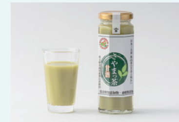
株式会社クリメン さやまっ茶甘酒