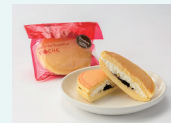
Pummy フローズンパンケーキ