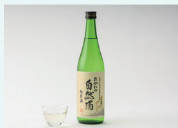
晴雲酒造株式会社 おがわの自然酒