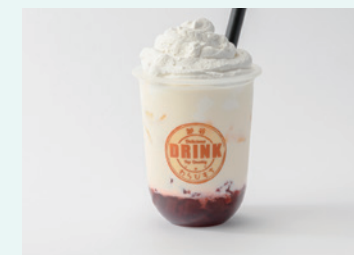
合同会社百幸 おうちでわらびもちドリンク