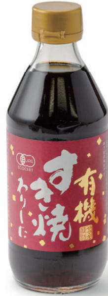
ヤマキ醸造株式会社 有機すき焼のわりした

農薬や化学肥料などを使わない、埼玉県産の有機米と、そのお米で仕込んだ粧だけで発酵させた甘酒の原液。調味料にもなります。