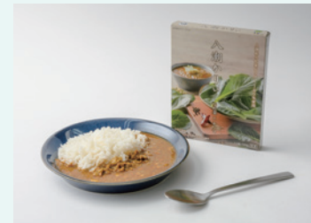
きー Curry 八潮かりい